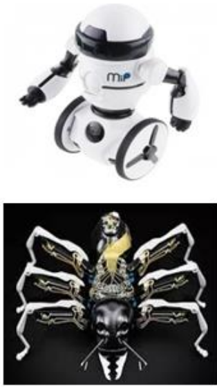
輪型 & 足型